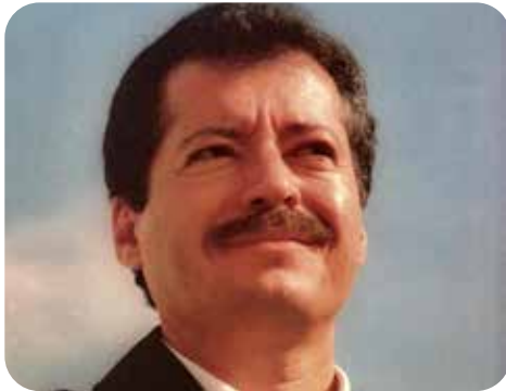
Luis Donaldo Colosio