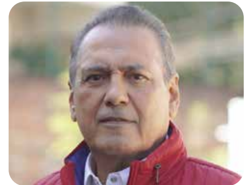
Manlio Fabio Beltrones

El sábado 20 de abril arrancaron las campañas para la Alcaldía de Cajeme. La ceremonia más tumultuosa fue la del alcalde Javier Lamarque en el centro, lo que permite augurar que no tendrá problemas para reelegirse por un segundo periodo.