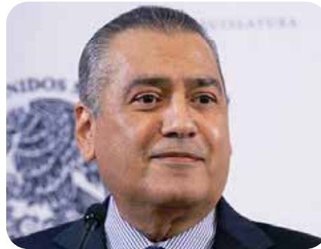
Manlio Fabio Beltrones