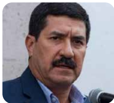
Javier Corral Jurado