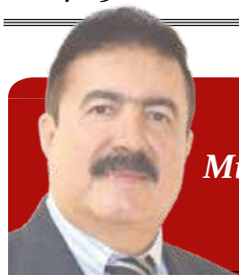
Columna de Miguel Ángel Vega C.